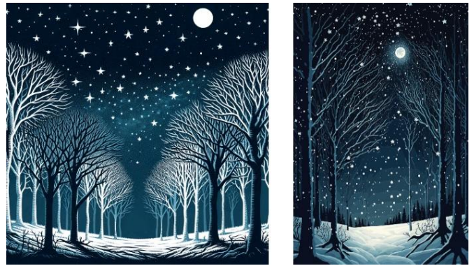
(그림 1) 별이 빛나는 밤 주제 작품 (좌: AI, 우: Hansuan_Fabregas of Pixabay illustrator [https://pixabay.com/vectors/snow-christmas-starry-night-7637124/])

작품 선정은 기술적 완성도, 창의성, 주제의 표현력을 기준으로 이루어졌다.